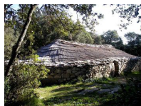
Au berceau de l'humanité Le site préhistorique de Cambous

Entre vignes et garrigues, venez découvrir des sites naturels magnifiques et des villages pittoresques au fil des routes des contreforts des Cévennes dominés par le Pic Saint Loup.