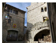
Viols le Fort, village médiéval où nous déjeunerons dimanche

Départ le samedi à 14h30 vers Le Caylar (sortie 49 - A75) (repas de midi à votre guise) Fin du Rallye à proximité de Clermont l'Hérault vers 16h30