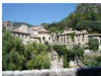
Saint Guilhem le Désert