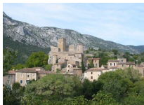
Les villages perchés de la vallée de la Buèges